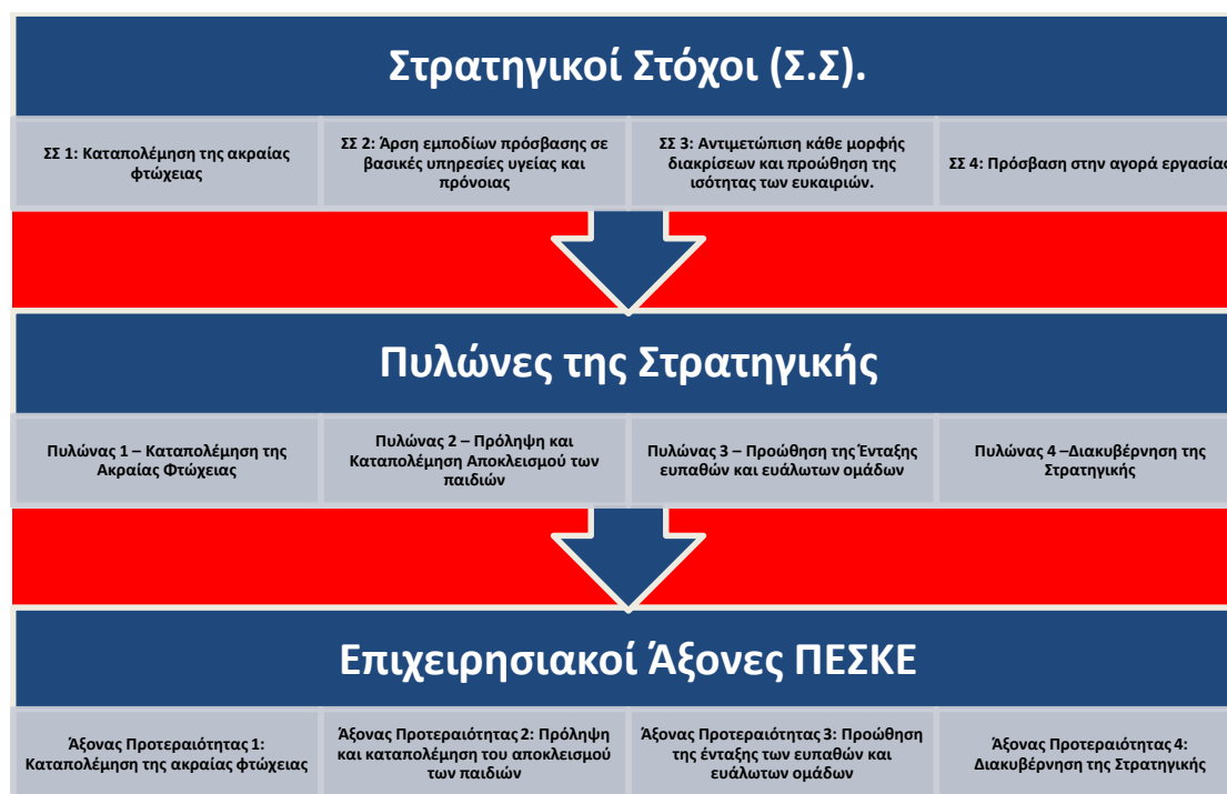
Σχήμα 1: Διασύνδεση Στρατηγικών Στόχων, Πυλώνων και Άξονων Προτεραιότητας

Κάθε Άξονας Προτεραιότητας εξυπηρετείται με Προτεραιότητες οι οποίες και θα υλοποιηθούν με θεματικά Μέτρα.